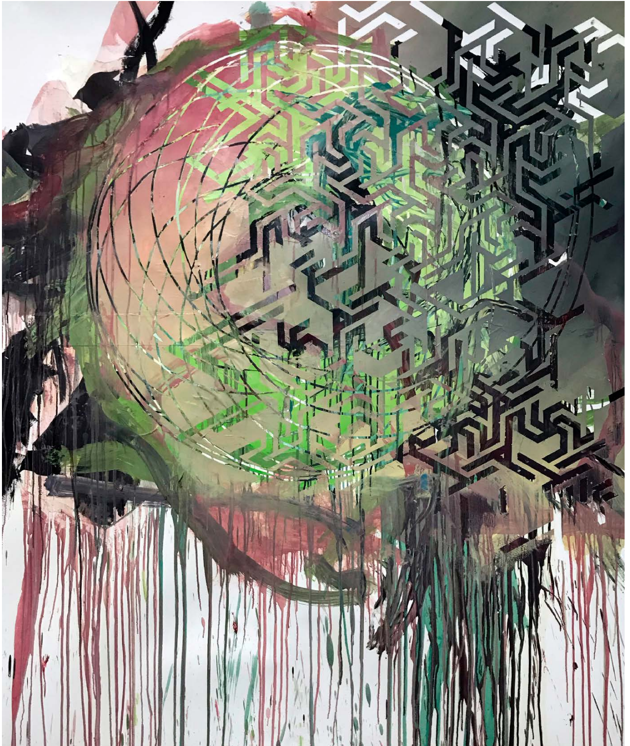
“O monge pierrot e o náufrago nupcial V”, 2020 Colagem e óleo sobre papel 170 x 152 cm