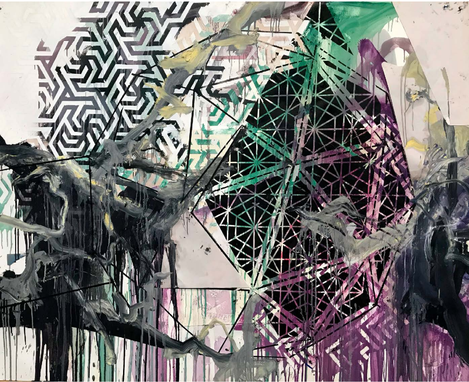
“O monge pierrot e o náufrago nupcial IV”, 2020 Marmorização, colagem e óleo sobre papel 152 x 180 cm