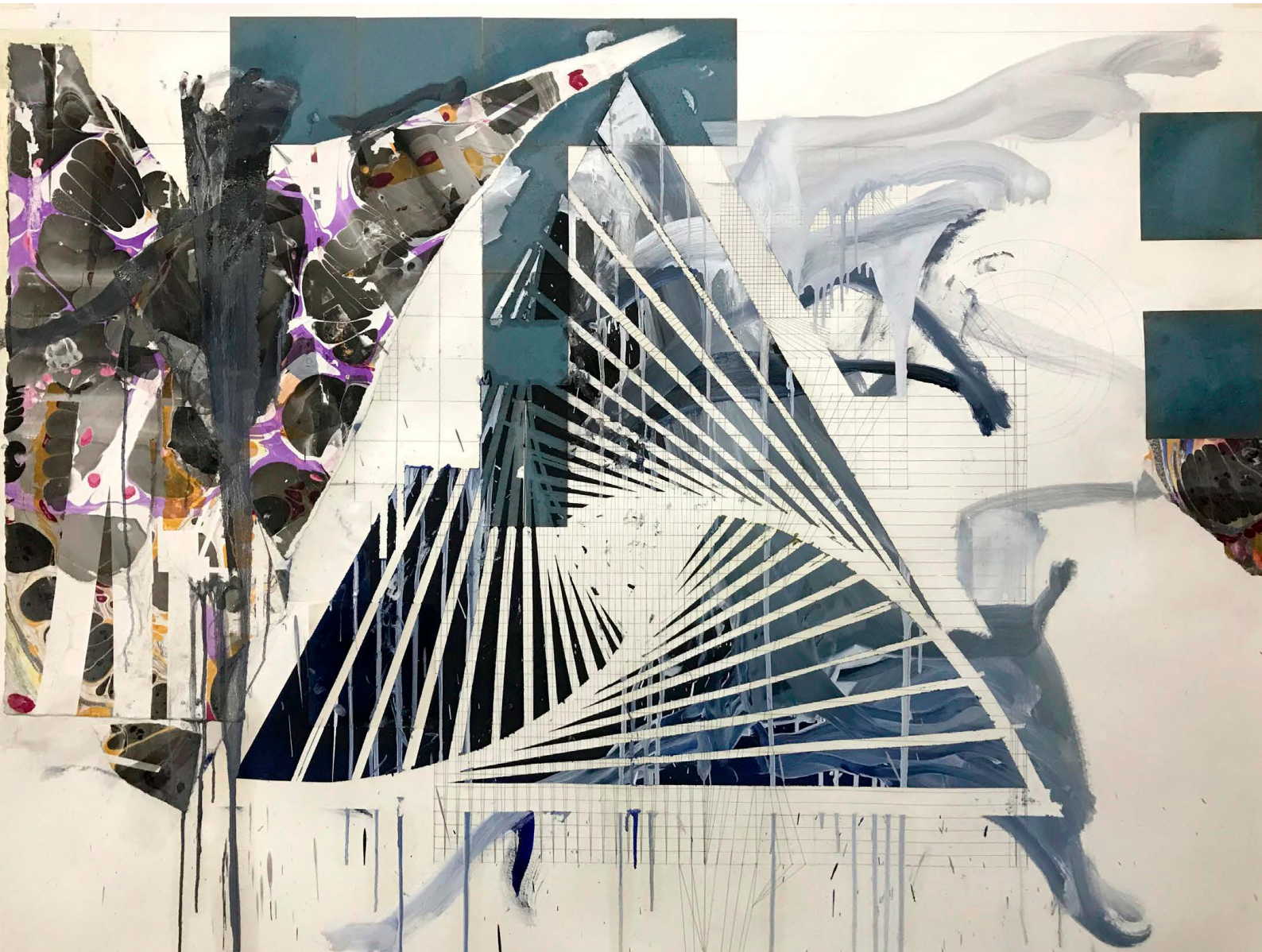
“O monge pierrot e o naufrago nupcial I”, 2020 Marmorização, colagem e óleo sobre papel 115 x 152 cm