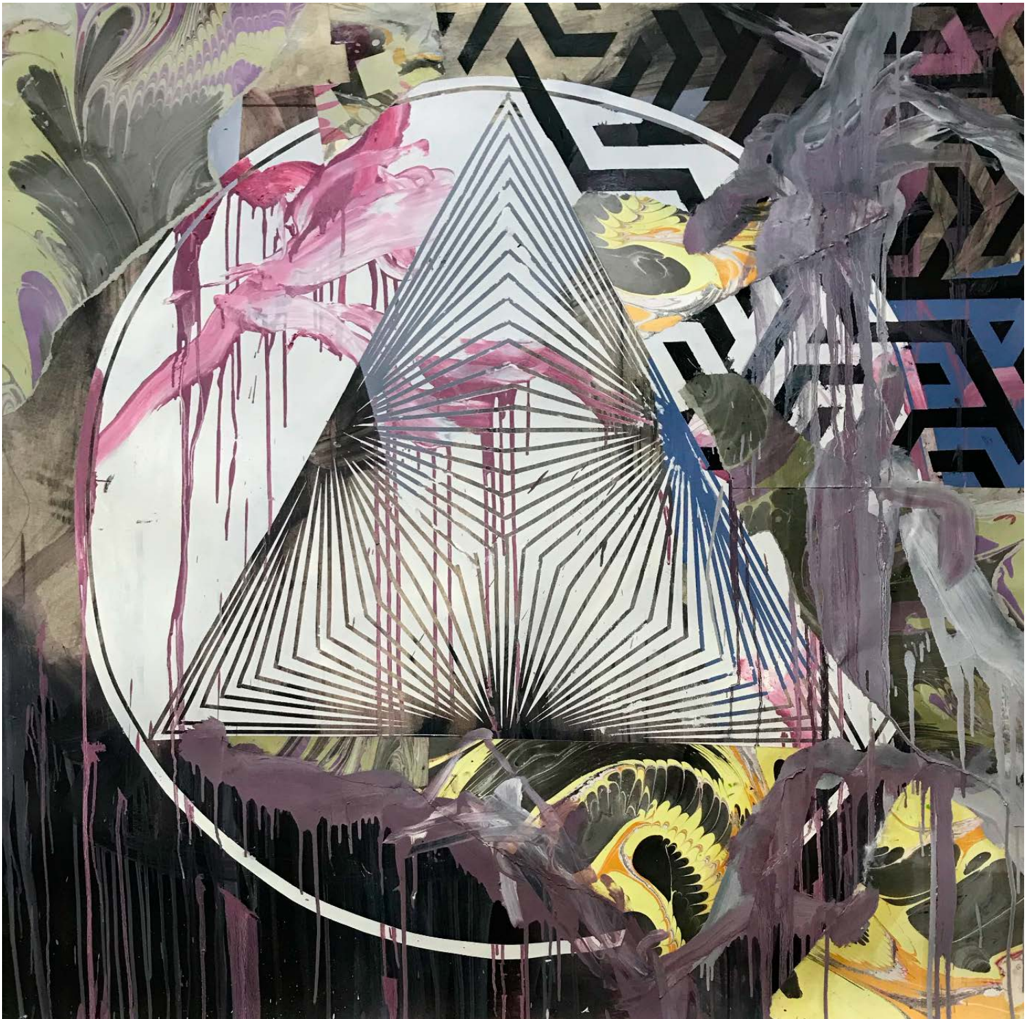
“O monge pierrot e o naufrago nupcial II”, 2020 Marmorização, colagem e óleo sobre papel 142 x 142 cm